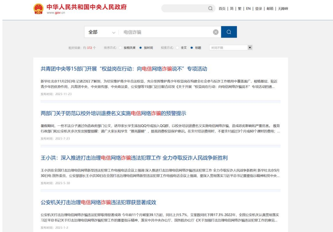
（图 1：中国政府网检索结果）

结果分析：根据检索结果可发现，国家高度重视关于电信诈骗的违法犯罪活动，有关安全部门积极参与，开展了许多关于防范电信诈骗的讲座及活动。近年来电信网络诈骗的立案数整体呈下降走势，可见反诈行动已取得一定成效。