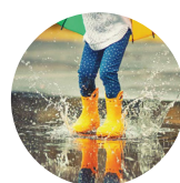
PUBLIC POLICY & ENVIRON- MENTAL MANAGEMENT 公共政策环境管理