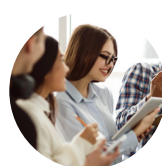
SOCIOLOGY OF THE FAMILY 家庭社会学