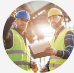
BUILDING AND CIVIL ENGINEERING 土木工程