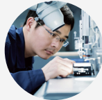
MATERIALS SCIENCE 材料科学