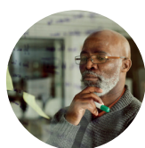
PERSONAL DEVELOPMENT 个人发展