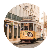
TOURISM & HOSPITALITY MANAGEMENT 旅游酒店管理

Emerald出版社成立于1967年，总部位于英国，由世界百强商学院Bradford University Business School的50名学者创立，主要出版学术期刊、科研图书和商业案例。学科领域包括但不限于管理学、经济学、会计学、金融学、信息科学、市场营销、工程学。