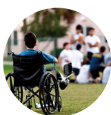
DISCRIMINATION IN EDUCATION 教育歧视

Emerald图书每年有300+册新增，涵盖200+个主题领域，包含学术专著、系列丛书和经典期刊论文集等，拥有来自全球前200强高引用机构的作者。Emerald曾获2019年英国图书奖年度学术、教育和专业出版商殊荣，并于2020年荣获2020 IPG年度独立出版商称号。