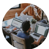
BUSINESS, MANAGEMENT & STRATEGY 商业管理与战略