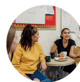
SOCIAL THEORY 社会理论