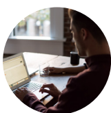
ACCOUNTING, FINANCE & ECONOMICS 会计金融与经济