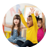
MULTI-CULTURAL EDUCATION 多元文化教育