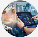
AUTOMATION AND CONTROL SYSTEMS 自动化和控制系统