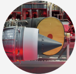
AEROSPACE ENGINEERING 航空航天工程