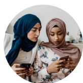
SOCIAL MEDIA 社交媒体