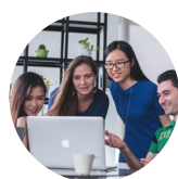
LIBRARY & INFORMATION SCIENCES 图书馆信息科学